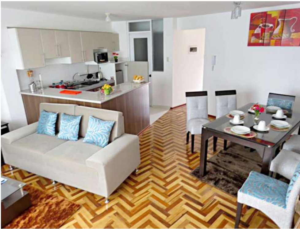
Piso de Quewe en Cusco