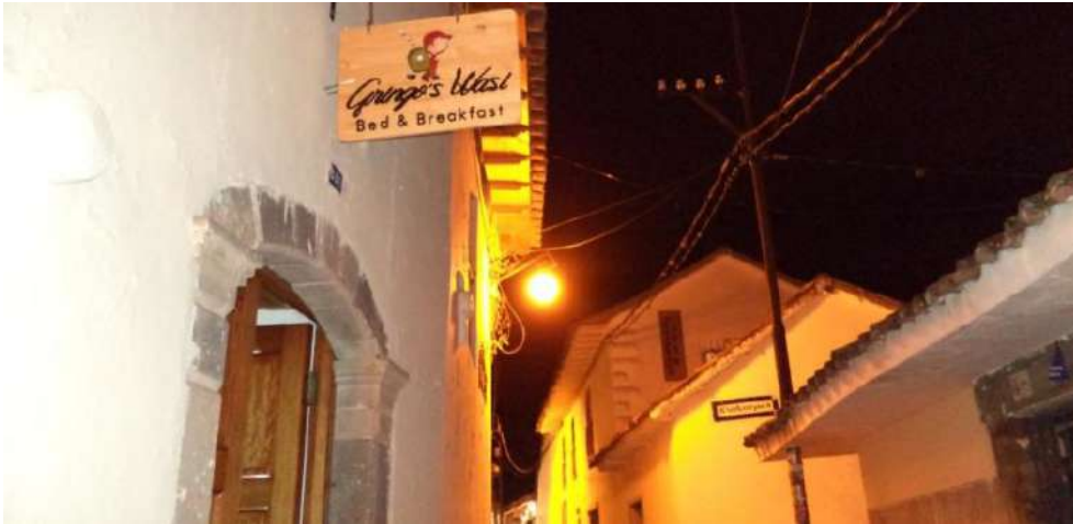
Gringo's Wasi Cusco

¡Reserva ya mi noche en Cusco! Gringo's Wasi- Dormitorio desde 5€