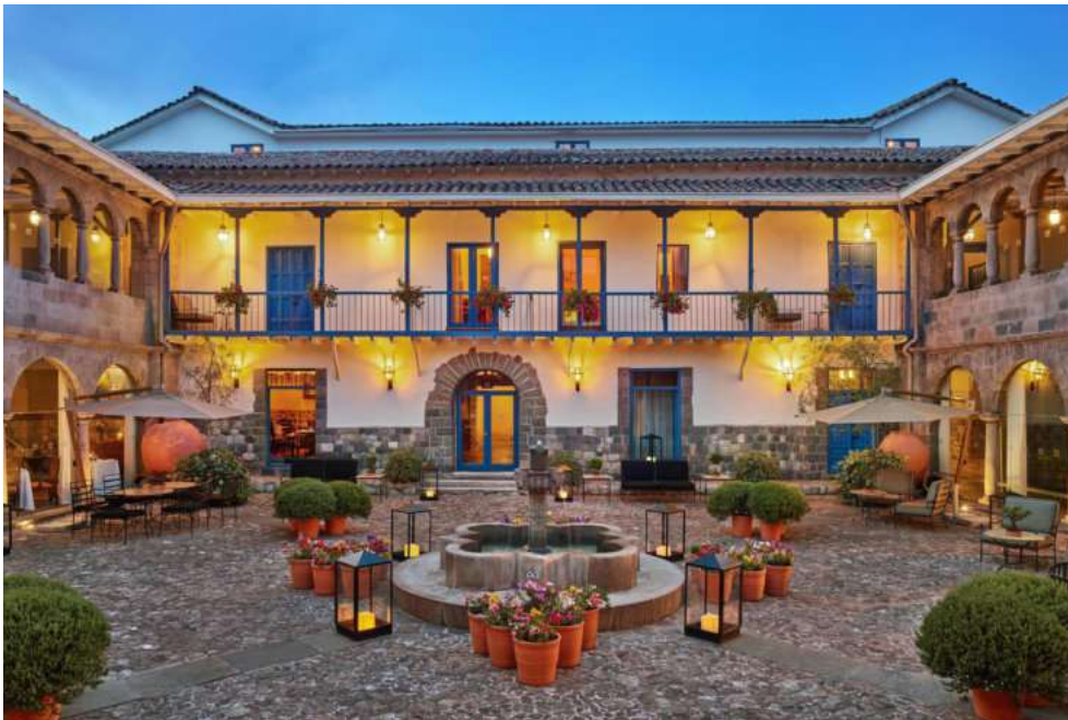
Palacio del Inka en Cusco