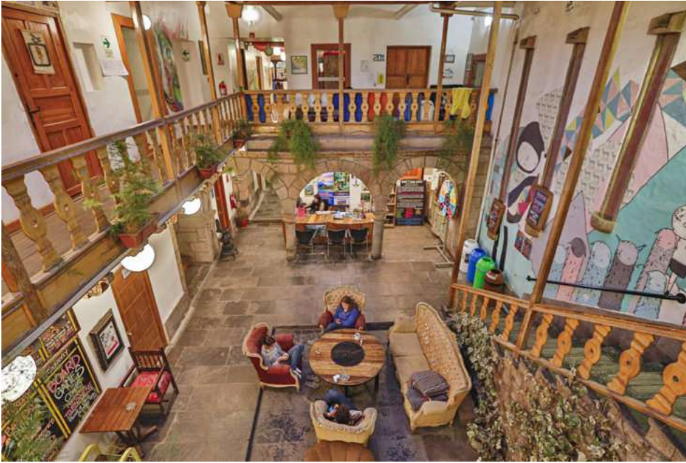
Kokopelli en Cusco

¡Reservo ya mi noche en Cusco! Kokopelli Hostal Cusco - desde 12€