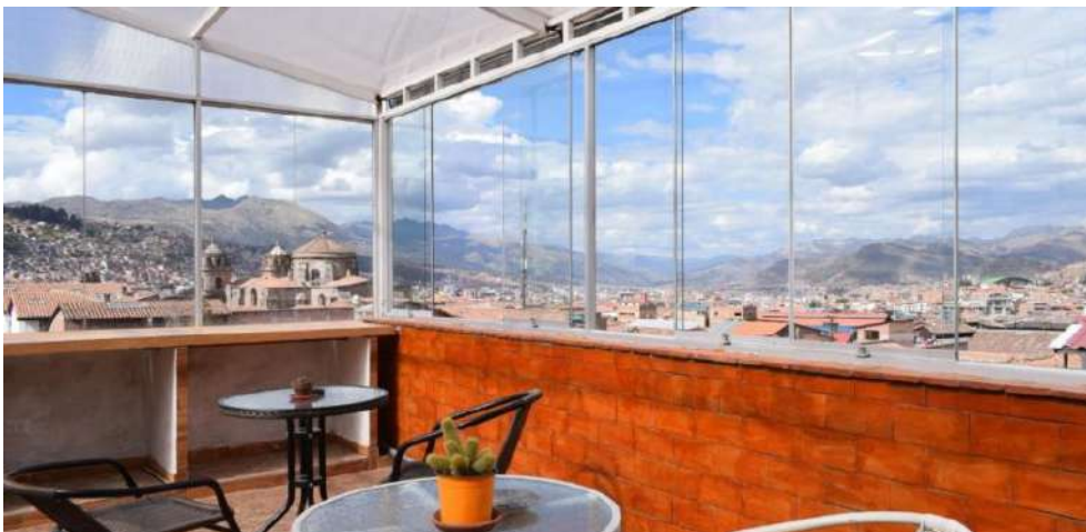
La Azotea Chusay Cusco

¡Reserva ya mi noche en Cusco! Chusay Rooftop - Dormitorio desde 10€