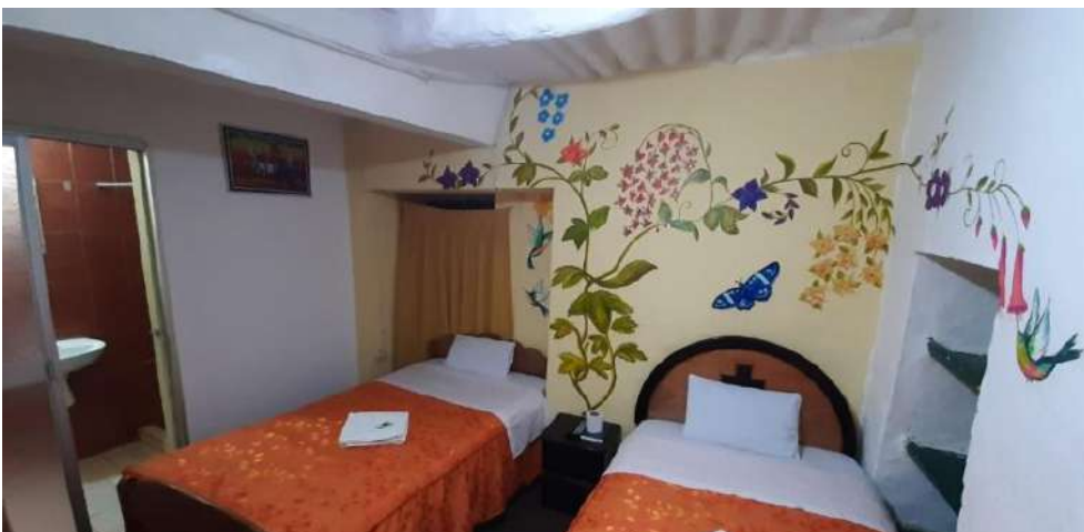
Hostal Sambleño Cusco Piero Suite

Hostal Sambleño Cusco Piero Suite- Habitación privada desde 10€