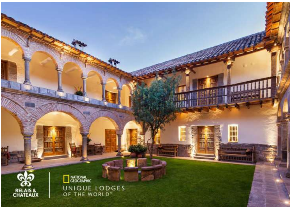
La Casona Inkaterra en Cusco