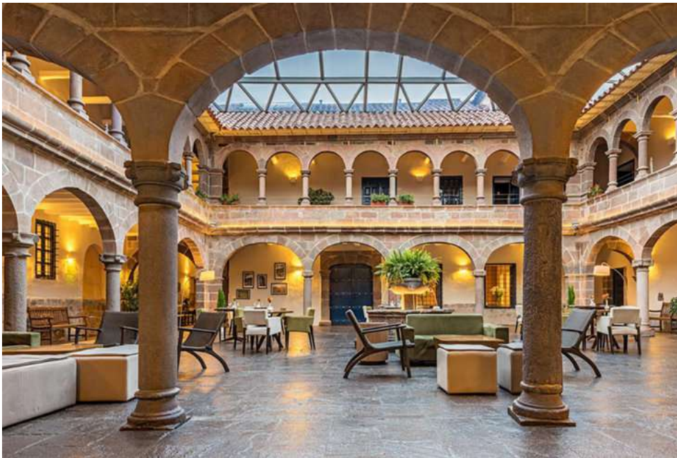
El Novotel en Cusco