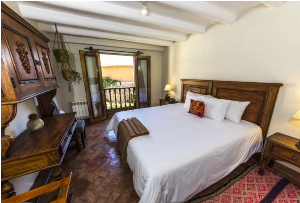
La habitación de la Antigua Casona San Blas en Cusco