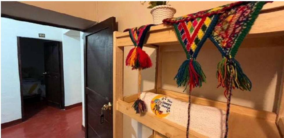
El Ratón Dormilón Cusco

¡Reservo ya mi noche en Cusco! The Sleepy Mouse - dormitorio desde 9€