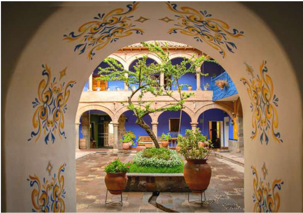
Tambo El Arriero Hotel Boutique en Cusco