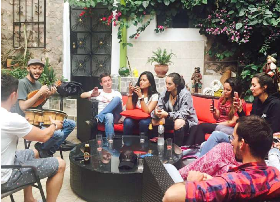
El albergue Blacky