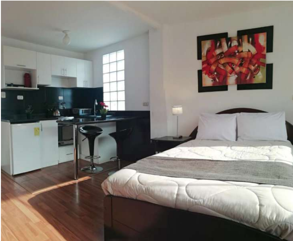
Apart Hotel Allincay Cusco