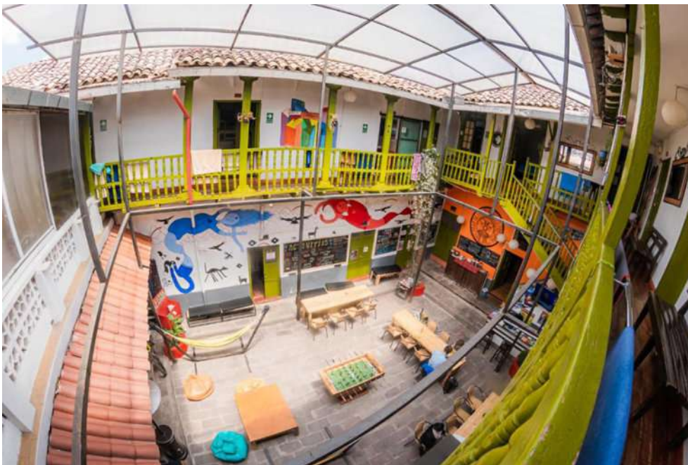
El patio del albergue Dragonfly, Cusco