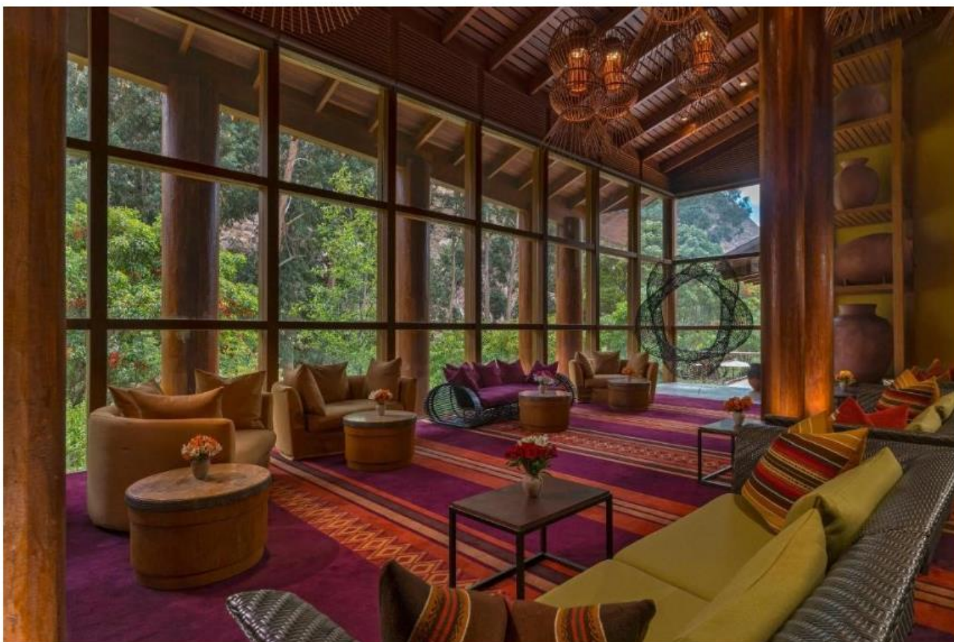
Tambo del Inka, a Luxury Collection Resort & Spa

Situado no coração do Vale Sagrado, no Peru, o Tambo del Inka, a Luxury Collection Resort & Spa oferece vistas incríveis para os cenários andinos da região. Quem se hospeda por lá pode provar receitas preparadas com ingredientes locais e relaxar com os tratamentos terapêuticos oferecidos no spa.