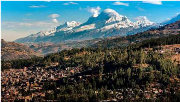
Parque Nacional Huascarán.