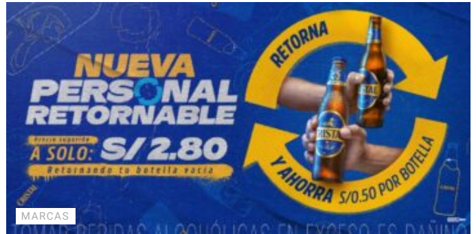
Cerveza Cristal apuesta por la HABILIDAD de los peruanos para retornar y AHORRAR