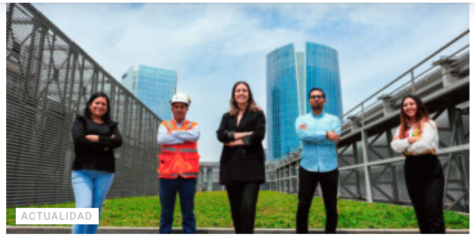
Urbanova, la primera inmobiliaria que recibe cuatro estrellas en el programa "Huella de Carbono Perú"