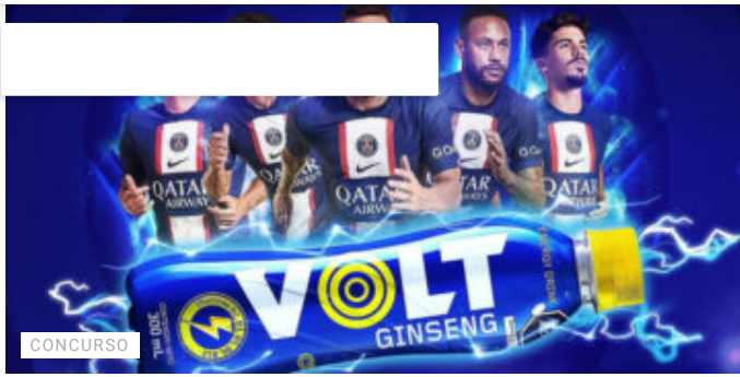
Regresa la campaña ReVOLTucion que te lleva a París a ver la final de la Liga Francesa