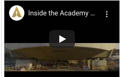
Film & Food: así son los museos que abren en 2019 en Los Ángeles