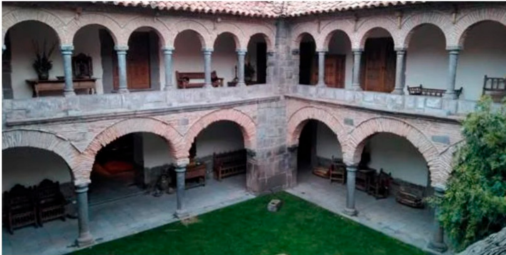
Inkaterra La Casona, Cusco