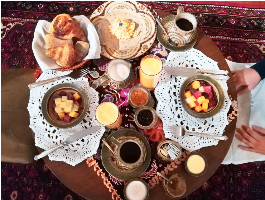
Desayuno en la habitación

The train left at 5 in the morning and we had to get up early, although for us it was a good time because we continued with the schedule of Spain. Breakfast was closed at that time, but they did not want us to leave without having breakfast and they prepared a spectacular breakfast in the room, it was such a great gesture.