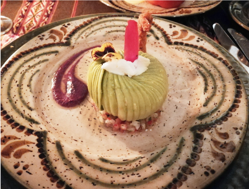
Cena en el restaurante

We dined at the hotel, which had a super rich kitchen and a lovely little restaurant. We go to bed early and rest well for our next trip to Aguas Calientes, heading to Machu Picchu.