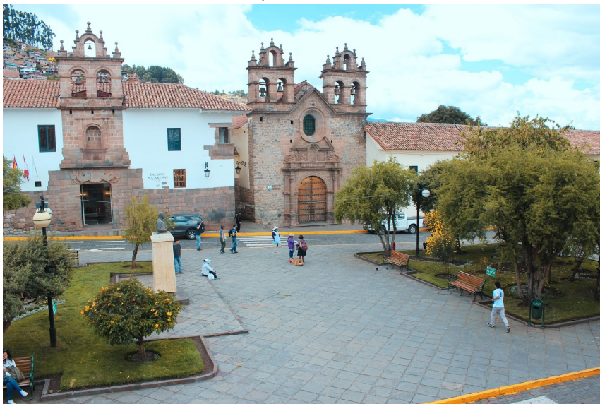
Plaza del las Nazarenas

No tengo palabras para la experiencia en Inkaterra, fue perfecta y lo recomiendo cien por cien si vais a Perú, vale la pena alojarse con ellos. Nunca lo olvidaremos, muchas gracias por todo.