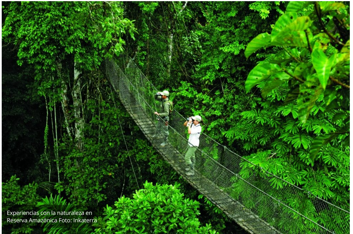
Experiencias con la naturaleza en Reserva Amazónica