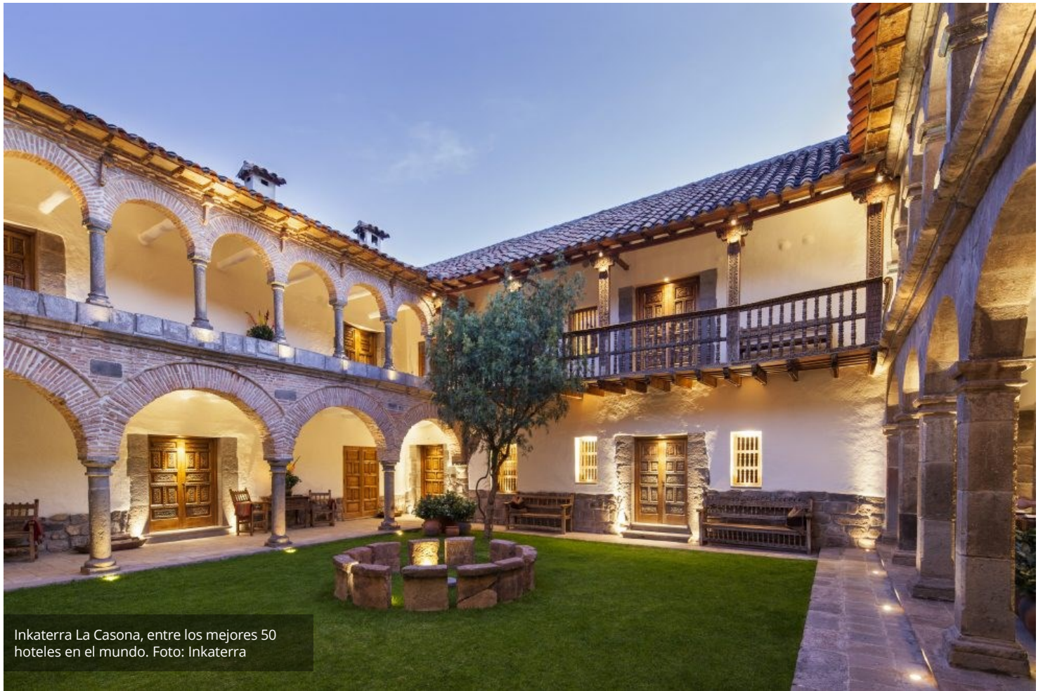
Inkaterra La Casona, entre los mejores 50 hoteles en el mundo.

🕒 7 días ago 👁 112 Vistas 📖 4 Tiempo de lectura