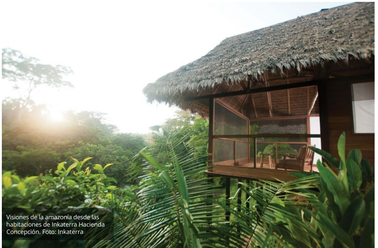
Visiones de la amazonía desde las habitaciones de Inkaterra Hacienda Concepción.