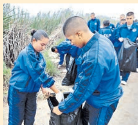
El humedal es un refugio de vida silvestre en la ciudad. DIFUSIÓN

En el marco del Día del Medio Ambiente, un grupo de estudiantes de diversas instituciones educativas realizaron ayer una jornada de limpieza de los Pantanos de Villa, en Chorrillos. La actividad fue organizada por Prohvilla, adscrita al municipio de Lima.