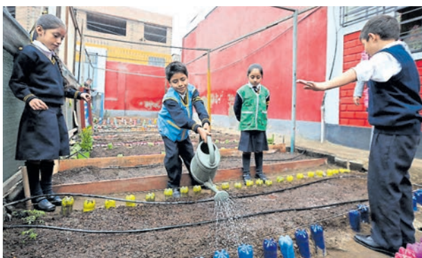
Los propios alumnos se encargan de hacer crecer este espacio. DIFUSIÓN