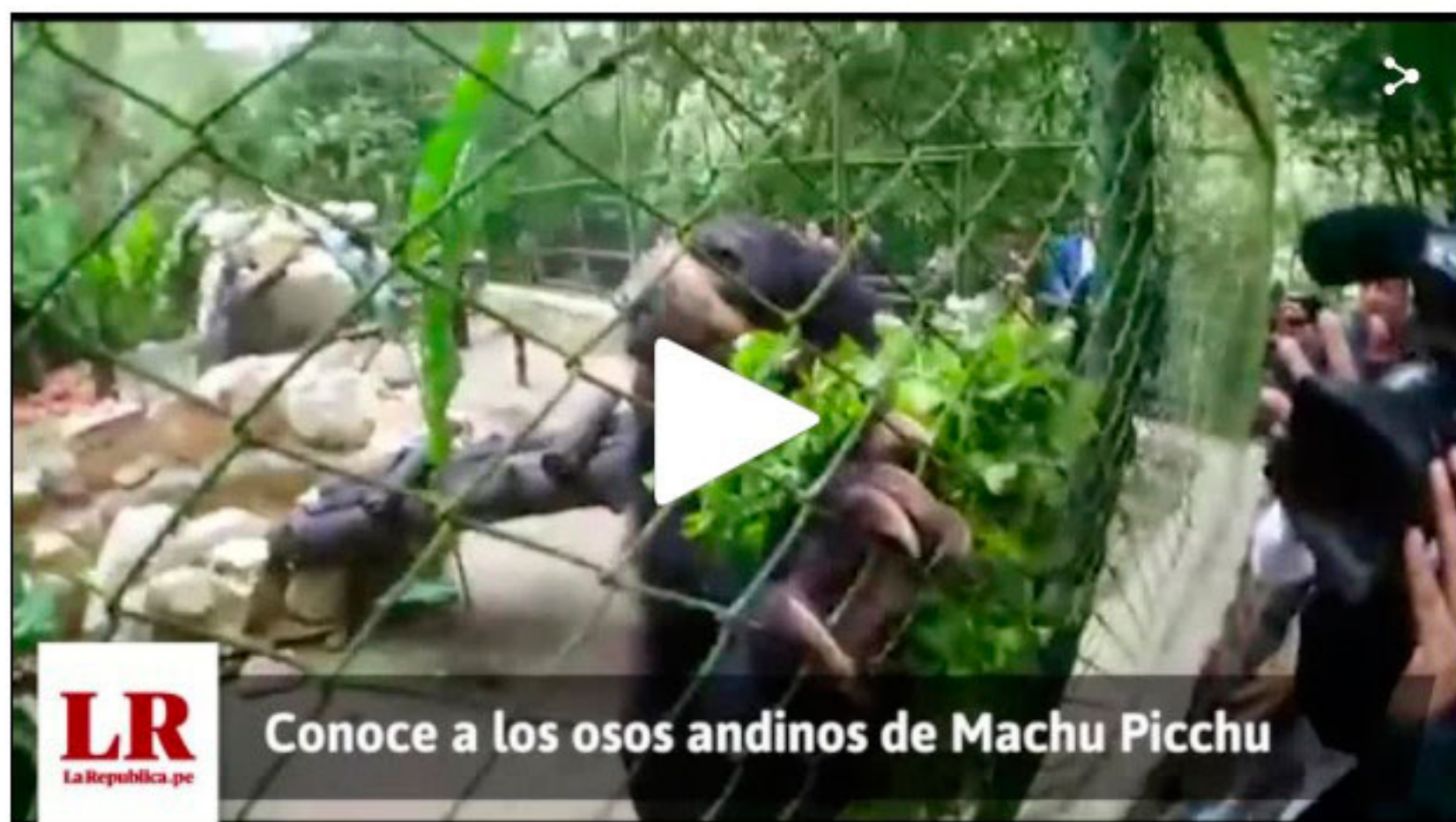
Yosi, Oso hembra que está en situación de semi libertad en el Centro de Conservación e Investigación del Oso Andino en Inkaterra Machu Picchu Pueblo.

Me gusta 770 Compartir Twitlear G+1 0 Enviar a un amigo