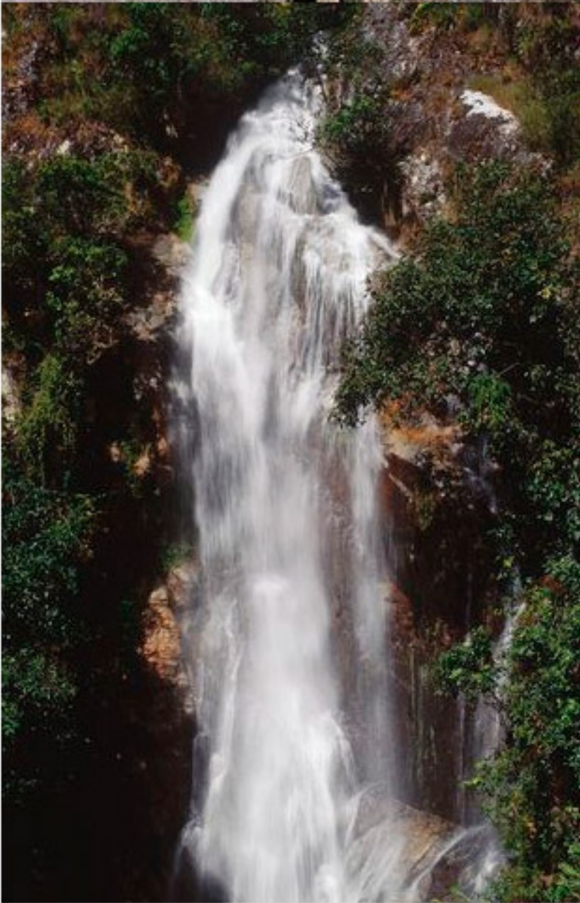
El Camino de la Purificación es parte de una ruta de ingreso a Machu Picchu.