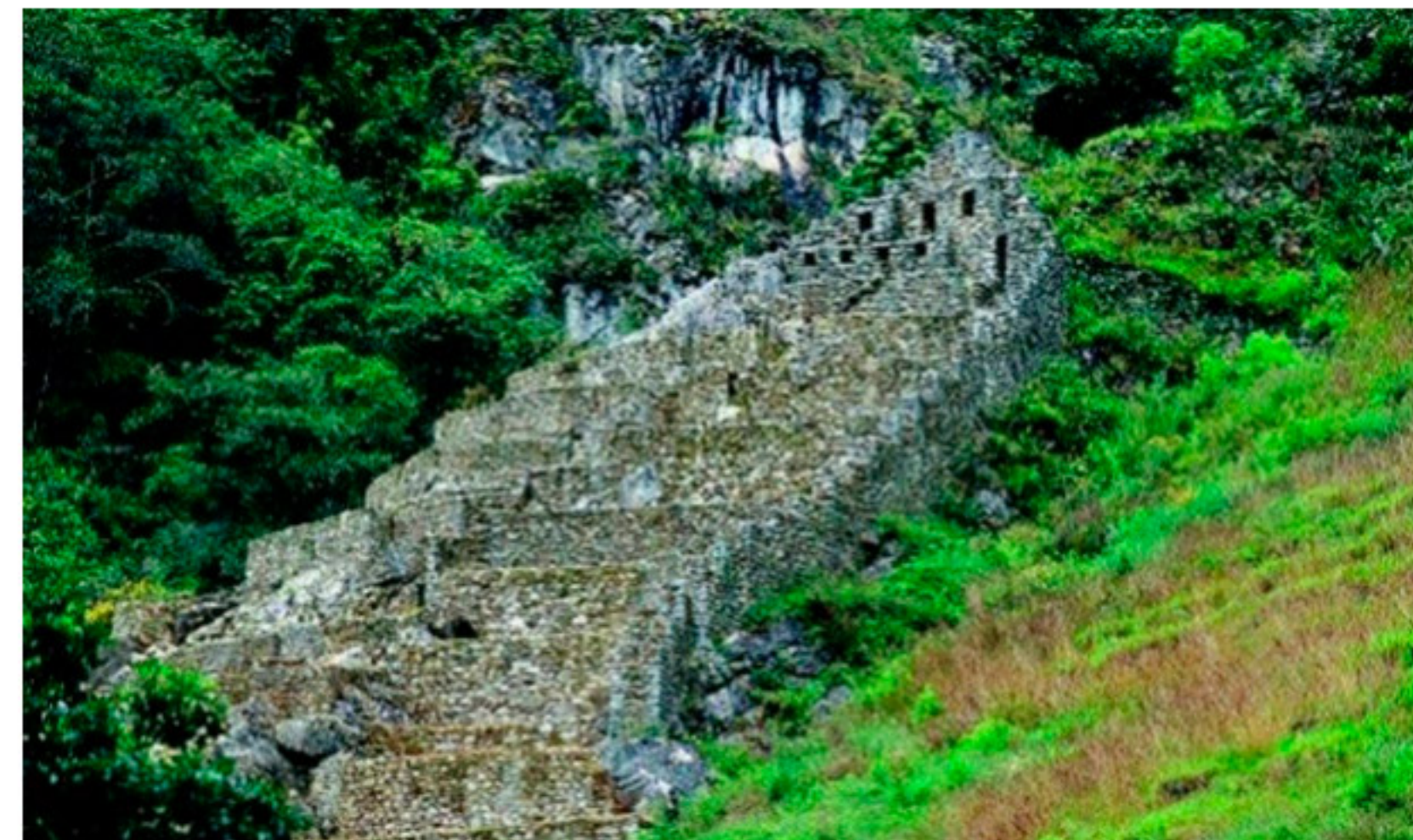
Choquesuysuy es un rincón escondido del Cusco milenario.

Me gusta Compartir 190 Twittear G+1 4 Enviar a un amigo