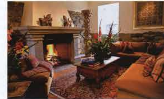
Sala de Inkaterra La Casona.

hacienda se encuentra muy cerca del lago Sandoval, maravilloso espejo de agua rodeado por palmeras, hábitat de monos aulladores, caimanes, lobos de río y una gran variedad de aves. Fue seleccionado en el Hot List 2012 de Condé Nast Traveler, en la categoría The Best New Hotels in the World.