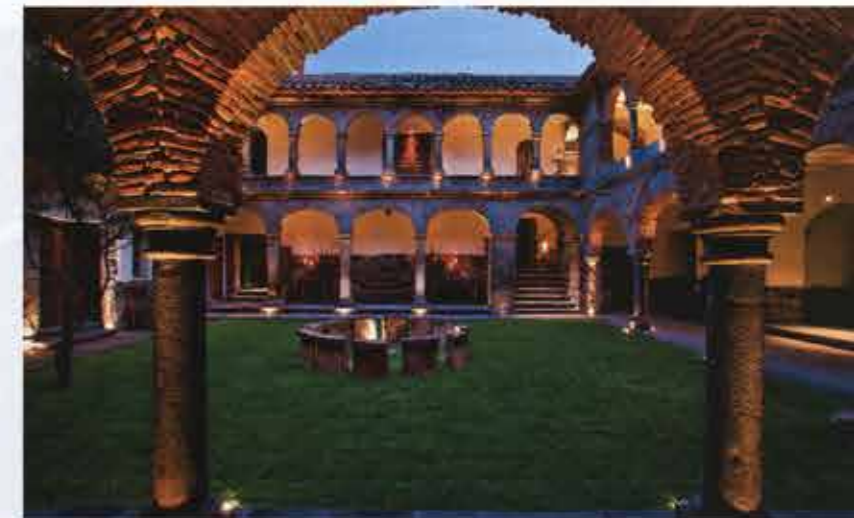
Patio principal de Inkaterra La Casona.