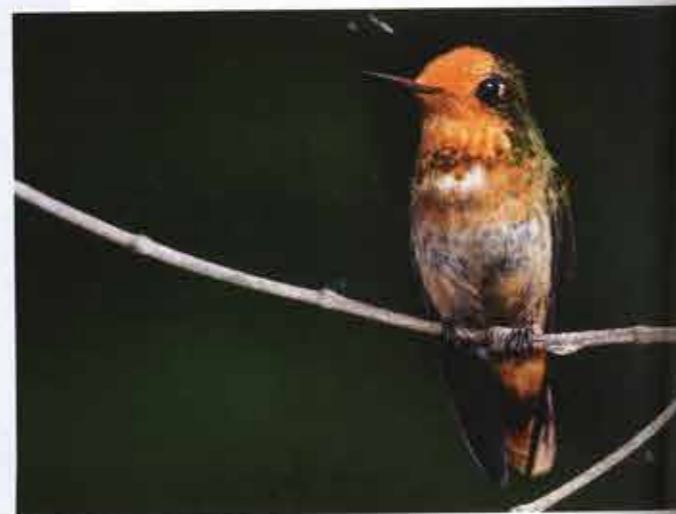
Coqueta de Cresta Rufa (Rufous-crested Coquette).

Debido a su megabiodiversidad, la accesibilidad de sus destinos e infraestructura turística, el Perú tiene todo el potencial para convertirse en el país de las aves. Inkaterra se enorgullece de poder colaborar y hacer de ello una realidad.