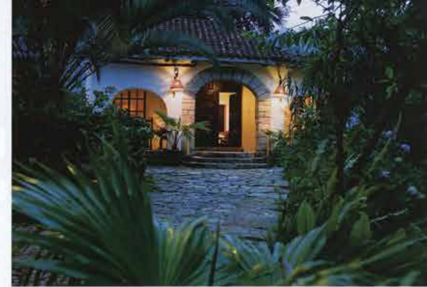
Entrada al lobby de Inkaterra Machu Picchu Pueblo Hotel.

Inkaterra Hacienda Concepción se encuentra en la Reserva Nacional de Tambopata, a 20 minutos de Puerto Maldonado. Renovada, manteniendo el estilo original de las haciendas amazónicas de los años cincuenta, la