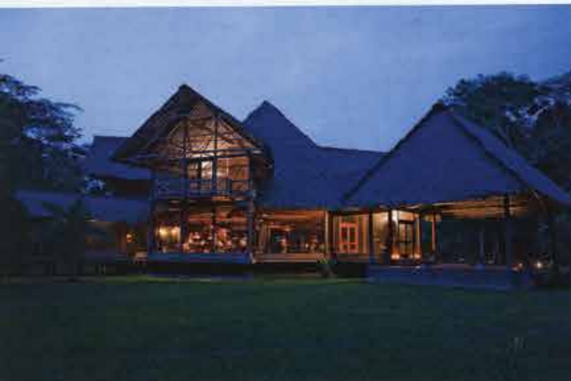
Arriba: Inkaterra Hacienda Concepción. Abajo: Inkaterra Reserva Amazónica.

De la Ciudad Imperial del Cusco a la Amazonía de Tambopata, los hoteles de Inkaterra se definen por su diseño simple en armonía con el entorno, resaltando la autenticidad de cada destino.