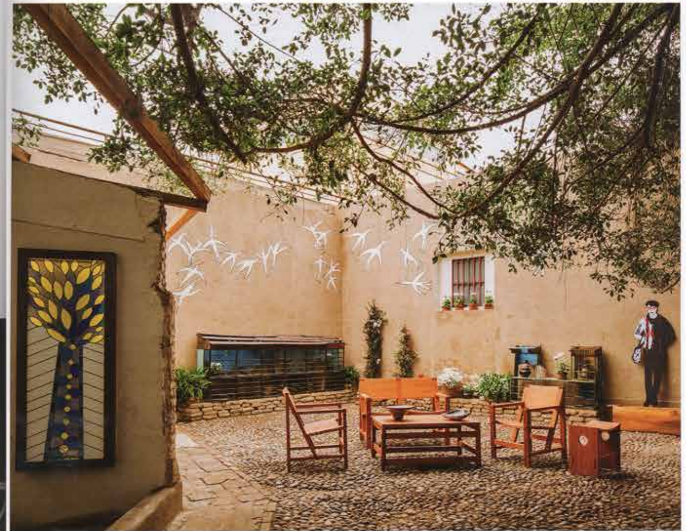
AMERICAN COLDERS • ARTESANOS DON BOSCO • INKATERRA • SAMSUNG