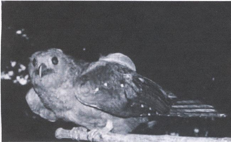
Steatornis caripensis reinsertado (21/1/2010) en Machu Picchu.

tandra reticulata) 3 , respondiendo muy bien al régimen dietético y de ese modo fue mantenido en cautiverio, durante diez días, tiempo que permaneció, durante el día en una amplia caja, y al anochecer era soltado en una habitación con suficiente cantidad de alimento.