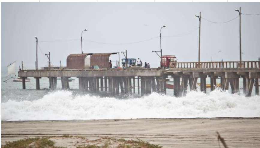
Impulsarán el turismo en Lobitos y Cabo Blanco.