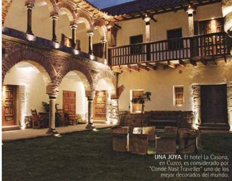
UNA JOYA. El hotel La Casona, en Cuzco, es considerado por "Condé Nast Traveller" uno de los mejor decorados del mundo.