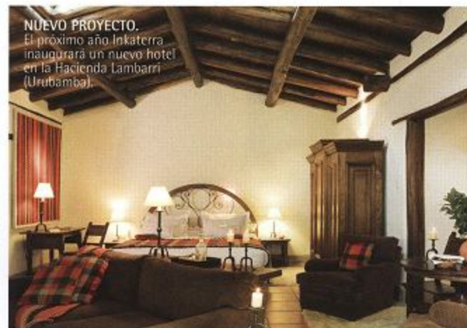
NUEVO PROYECTO. El próximo año Inkaterra inaugurará un nuevo hotel en la Hacienda Lambarri (Urubamba).

botes que salen a navegar..." cuenta Koechlin desde la cabina de mando de la Miss Texas. Esta nave estuvo desde hace muchos años en La Punta, y había sido transformada en un yate de paseo. Un equipo de talentosos astilleros le ha devuelto su espíritu original de bote de pesca, con cajones para aparejos, silla de pesca y una terraza libre de muebles para subir peces grandes. Tiene 41 pies de eslora, pesa un poco más de diez toneladas y la impulsa un motor Volvo Penta 380.