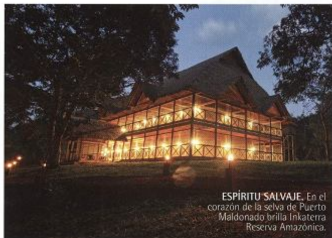
ESPIRITU SALVAJE. En el corazón de la selva de Puerto Maldonado brilla Inkaterra Reserva Amazónica.

dujo la película "Aguirre, la ira de Dios" de Werner Herzog, que fue filmada en parte en el Perú. El largometraje estuvo tres años en las carteleras de los cines de París y trajo la primera oleada de turistas franceses a nuestro país, interesados en conocer la Amazonia.